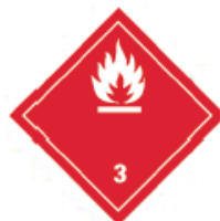
图 2 《联合国规章范本》中易燃液体的象形图

5.1.4.2.2 对于运输,应当使用规章范本规定的象形图(在运输条例中通常称为标签)。规章范本规定了运输象形图的规格,包括颜色、符号、尺寸、背景对比度、补充安全信息(如危险种类)和一般格式等。运输象形图的规定尺寸至少为 100 mm×100 mm,但非常小的包装和高压气瓶可以例外,使用较小的象形图。运输象形图包括标签上半部的符号。规章范本要求将运输象形图印刷或附在背景有色差的包装上。以下例子是按照规章范本制作的典型标签,用来标识易燃液体危险,见图 2。