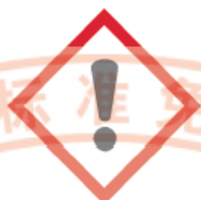
图 3 皮肤刺激物象形图