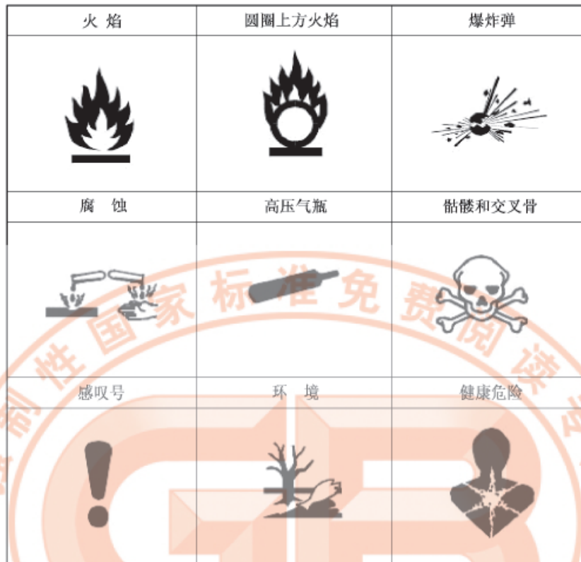
图 1 GHS 中应当使用的标准符号